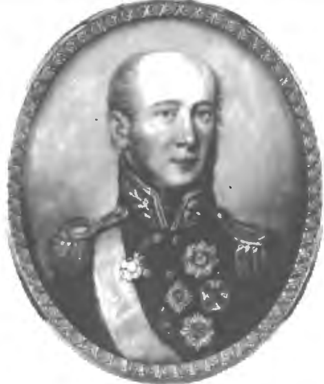
Князь М. Б. Барклай-де-Толли