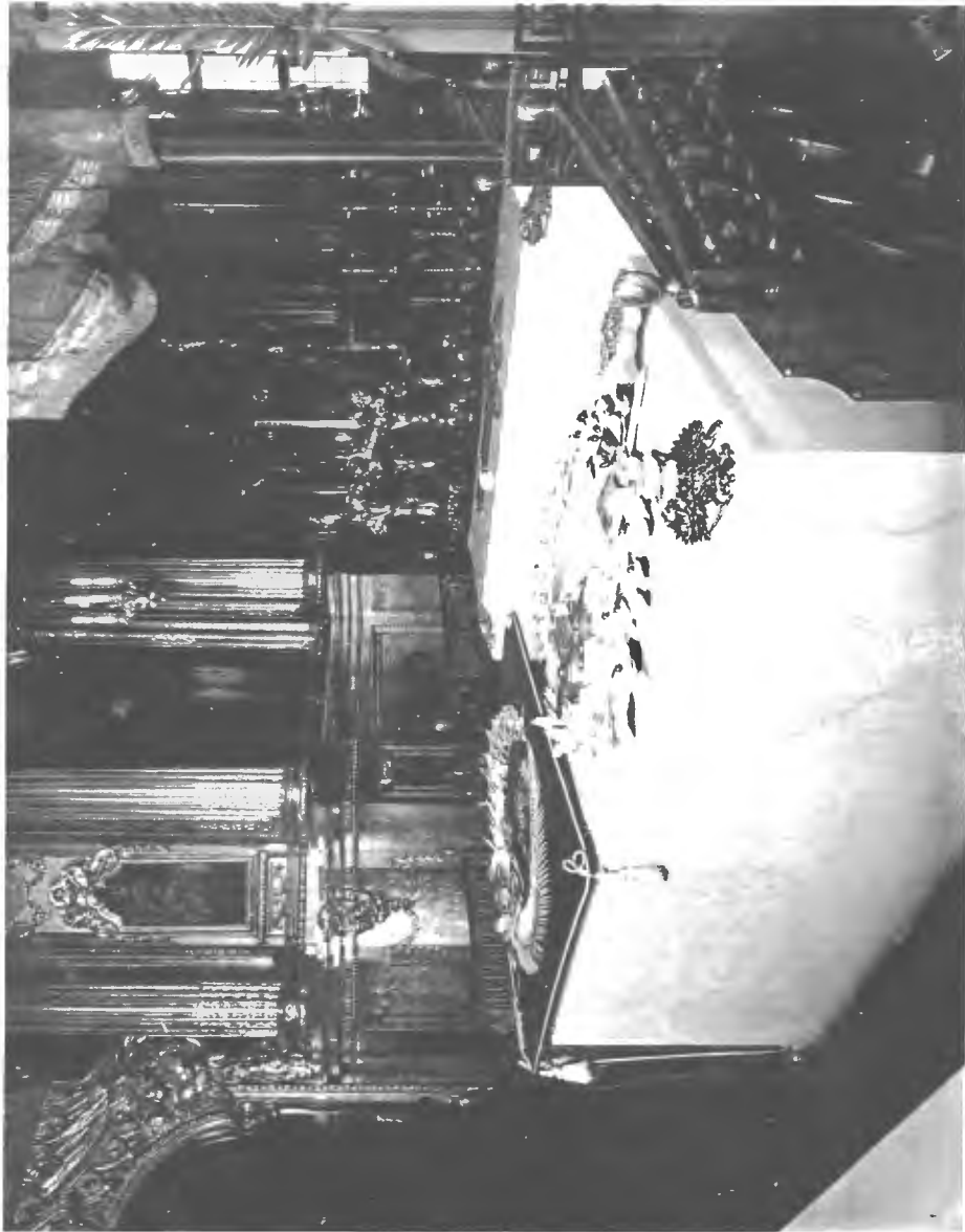
Могила Императора Александра I въ Петропавловскомъ соборѣ