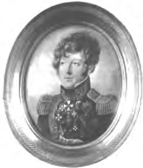
Графъ М. А. Милорадовичъ