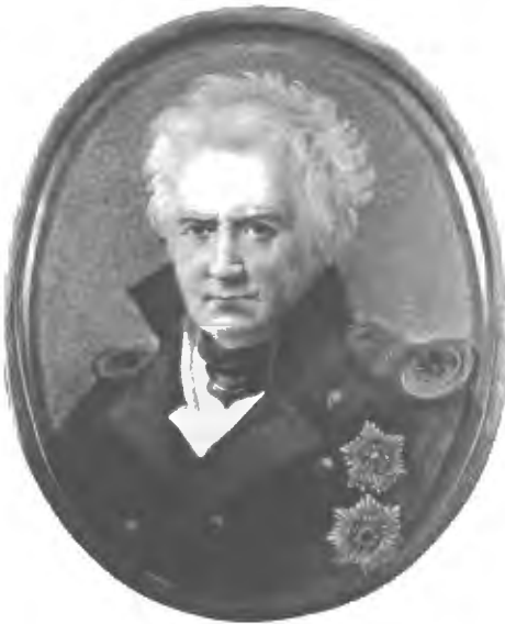
А. С. Шишковъ