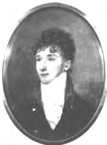
Графъ Н. А. Толстой