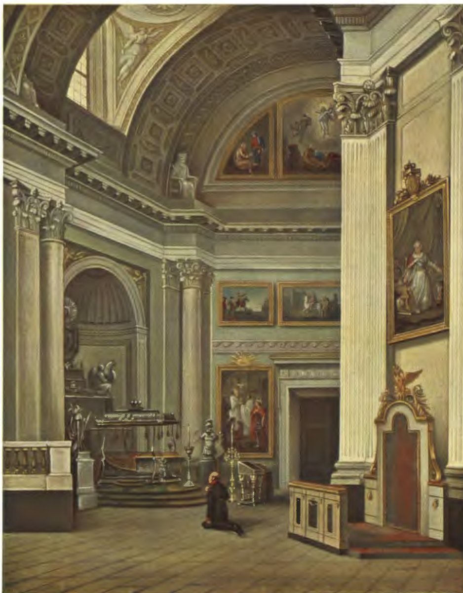
Императоръ Александръ I въ соборъ Александро-Невской лавры 1 сентября 1825 года