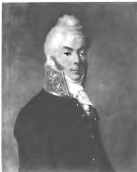
Н. Н. Новосильцовъ