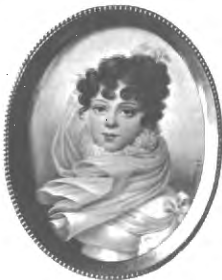
Великая Княгиня Екатерина Павловна