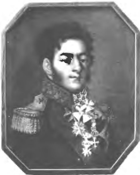
Князь П. И. Багратионъ