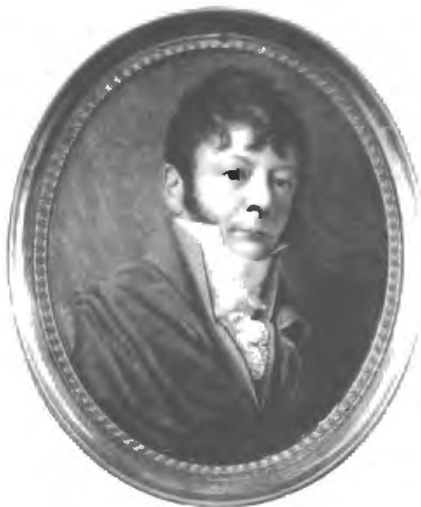
Графъ В. П. Кочубей