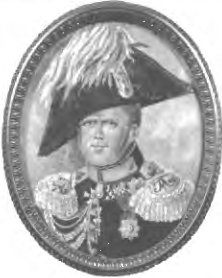
Цесаревич Константинъ Павловичъ