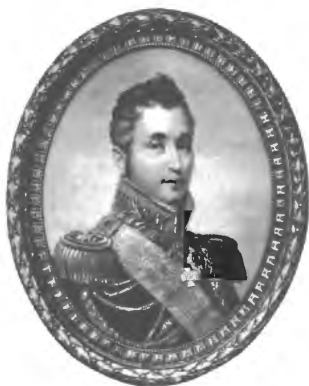
Графъ К. О. Поццо-ди-Борго