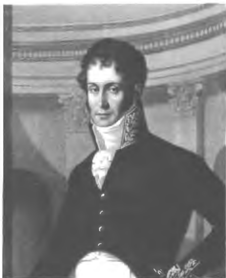
Князь А. А. Чарторжскій