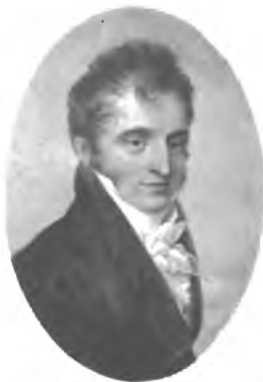
Графъ К. В. Нессельроде