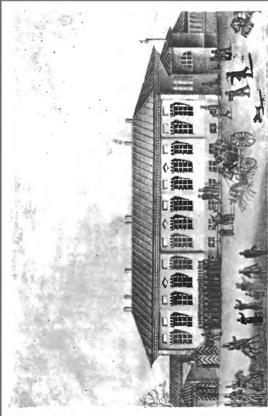
Домъ въ Таганрогѣ, гдѣ жилъ и скончался Императоръ Александръ I