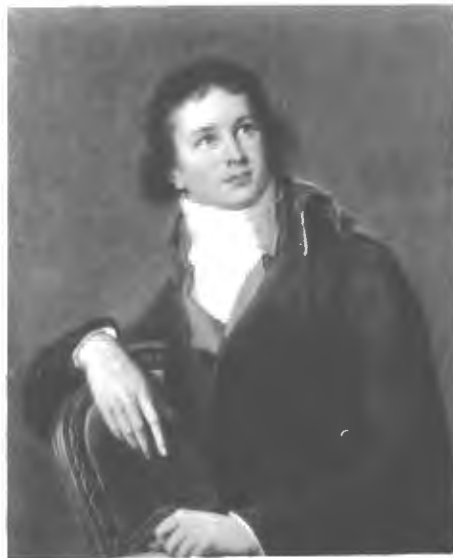
Графъ П. А. Строгановъ