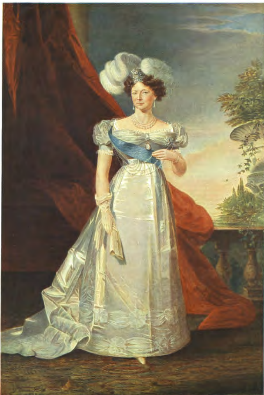
Императрица Марія Феодоровна