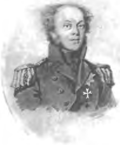
Графъ О. В. Ростопчинъ