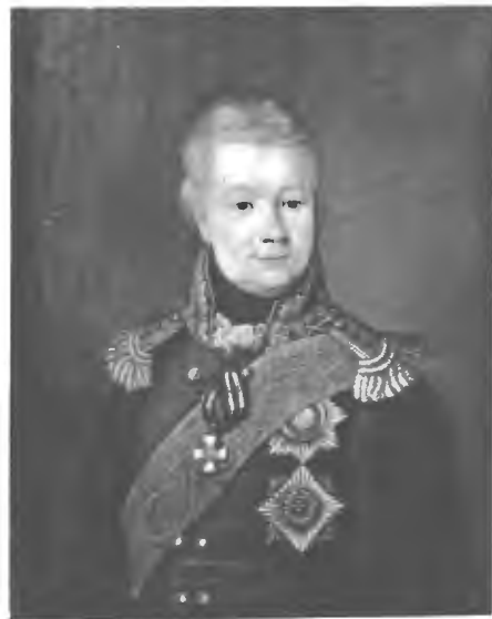
П. В. Чичаговъ