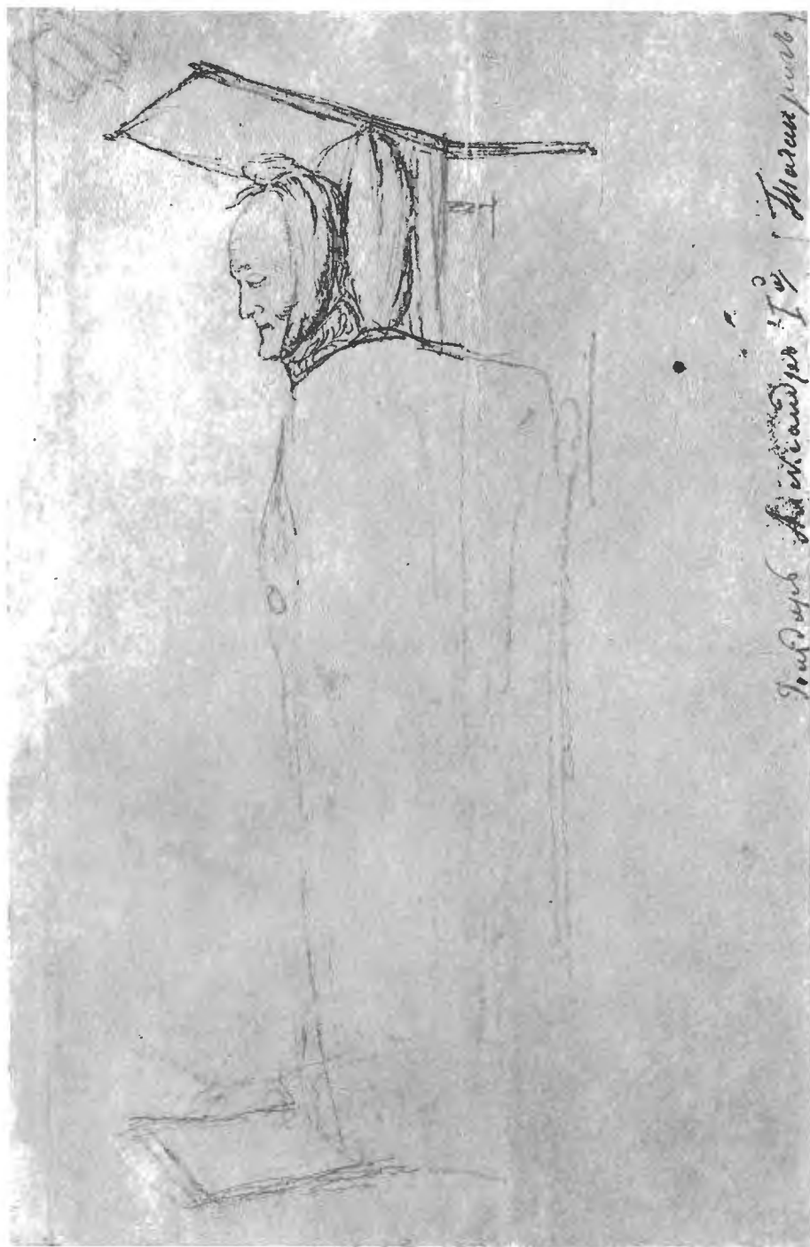
Императоръ Александръ I на смертномъ одрѣ