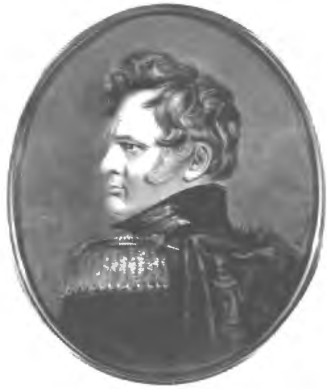
А. П. Ермоловъ