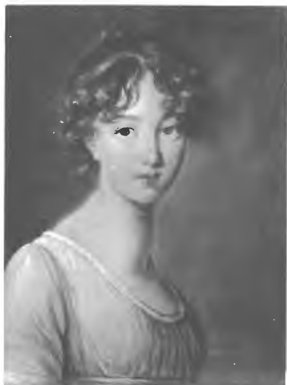
Императрица Елисавета Алексеевна