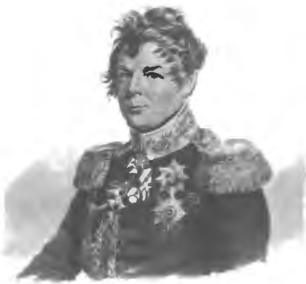
Графъ И. И. Дибичъ