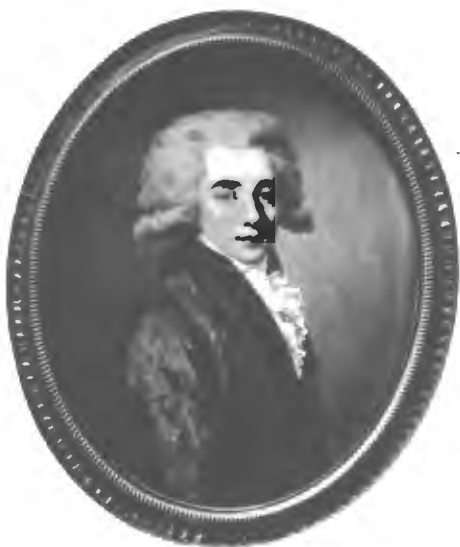
Графъ Н. П. Панинъ