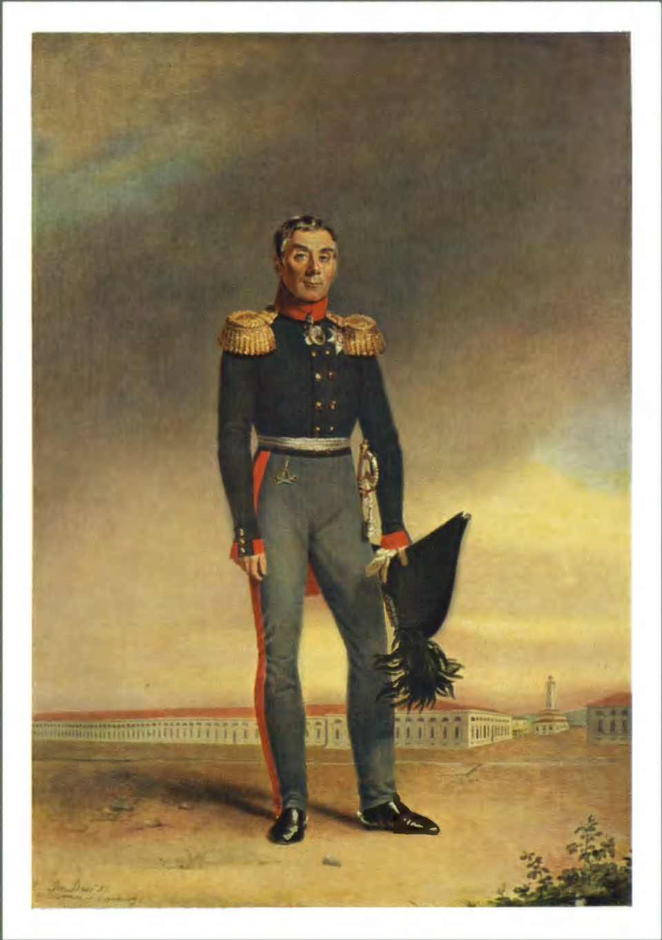
Графъ Алексѣй Андреевичъ Аракчеевъ