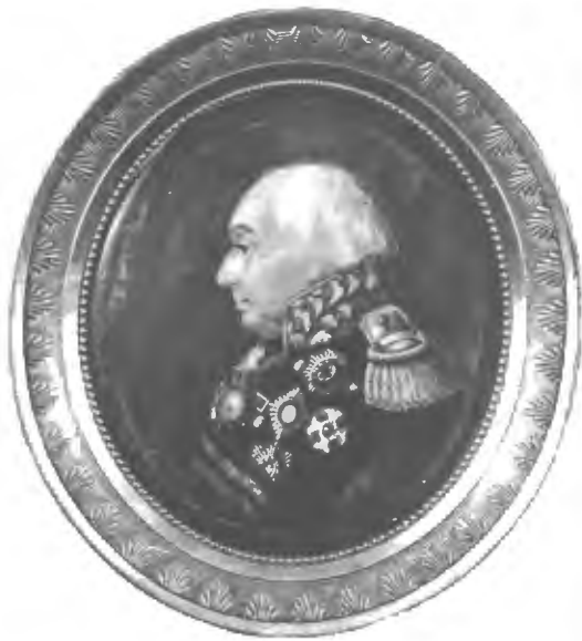
Князь М. И. Кутузовъ