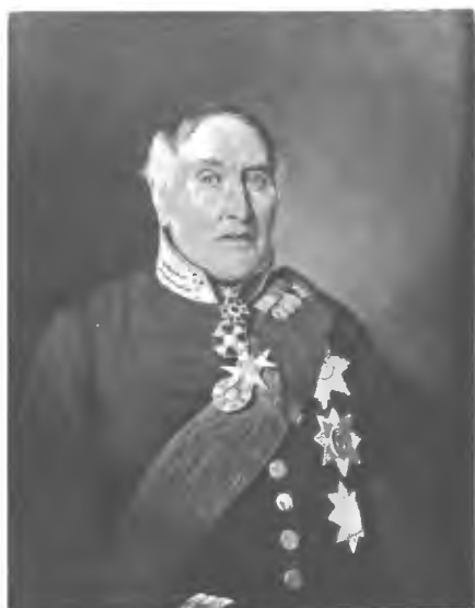
Баронетъ Я. В. Вилліе