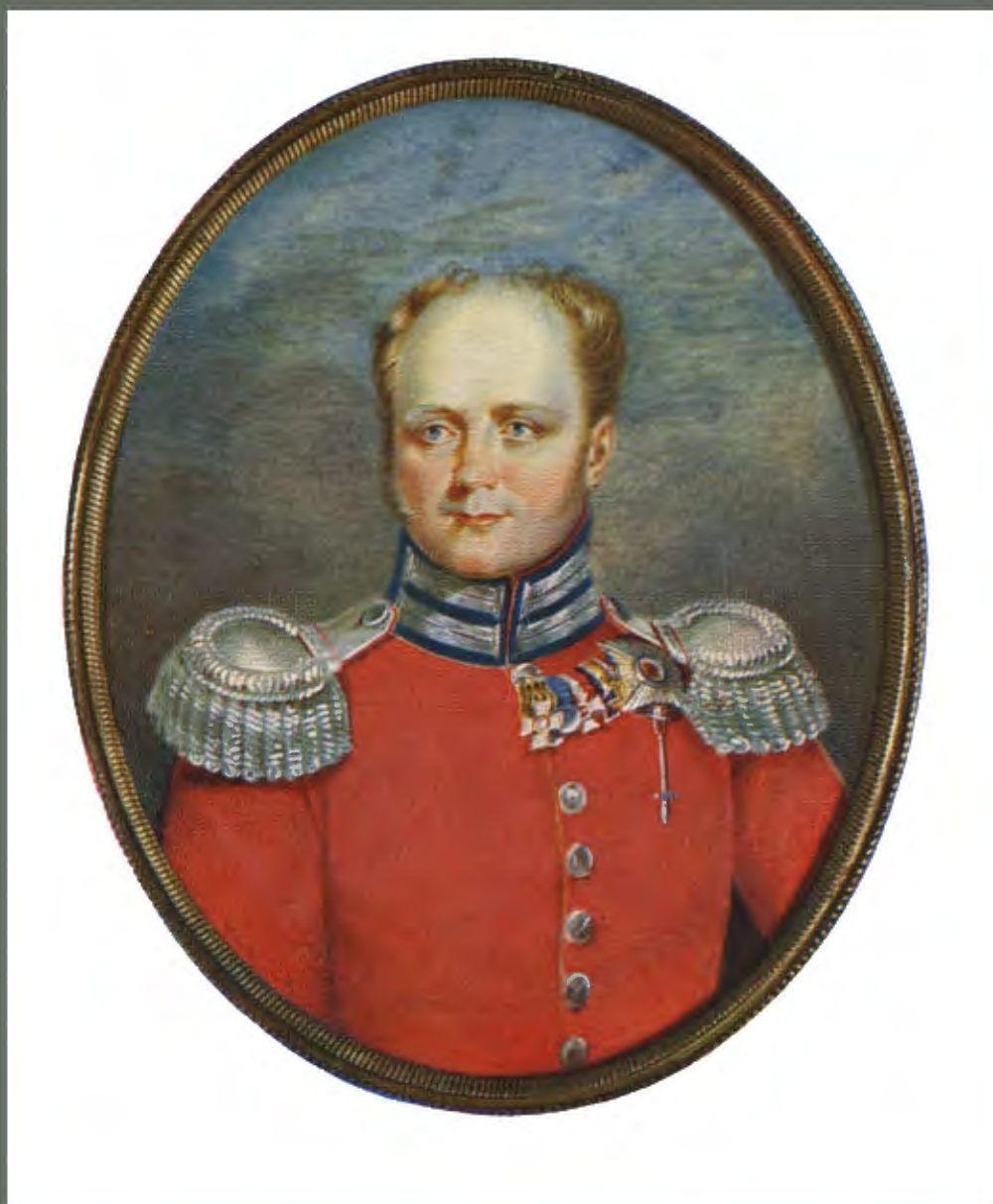
Императоръ Александръ I