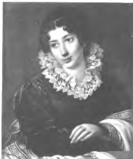
Баронесса Ю. Крюденеръ