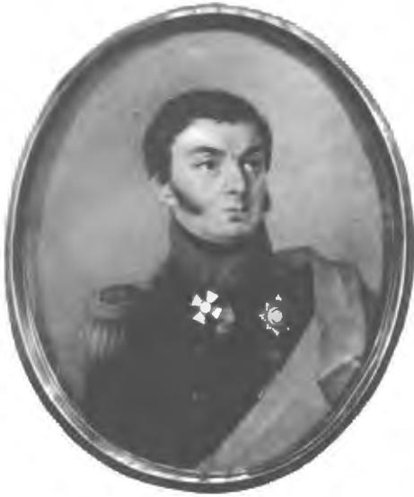
Н. Н. Раевский