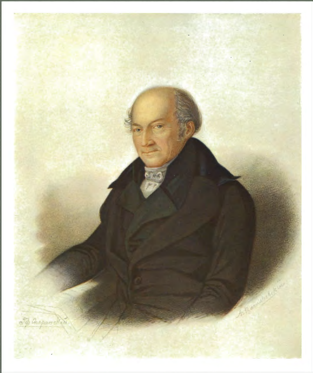
Графъ Михаилъ Михайловичъ Сперанскій