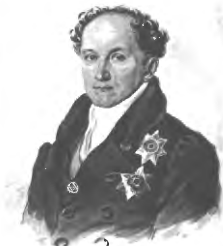
Князь А. Н. Голицынъ