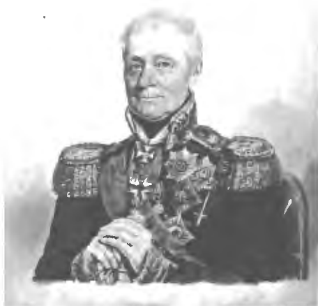
Графъ Л. Л. Беннигсенъ