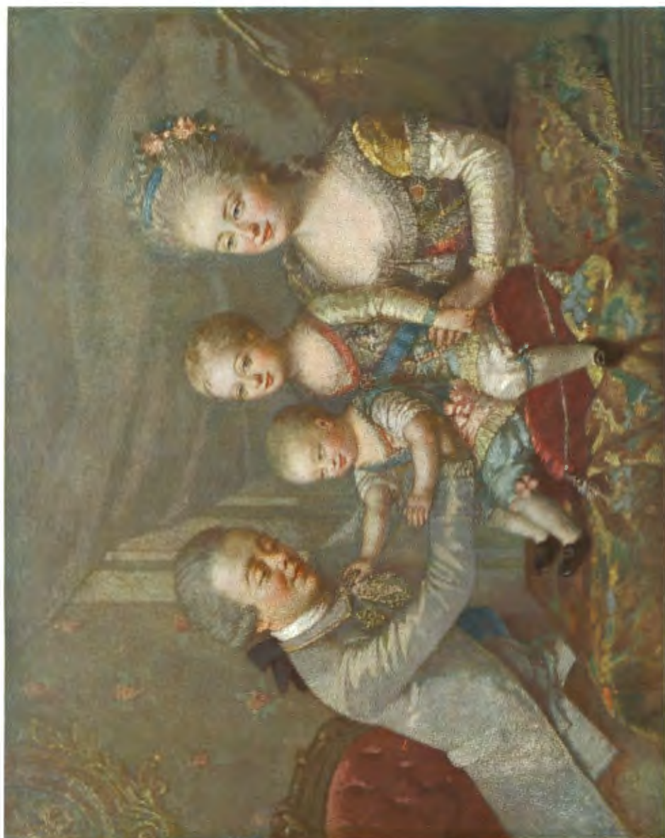
Великий Князь Павел Петровичъ съ супругою и сыновьями, Александромъ и Константиномъ