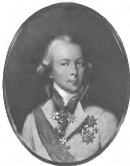
Графъ П. А. Паленъ